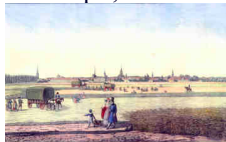
Leipzig von der Morgenseite- 1830

Ein Blick auf die politischen und gesellschaftlichen Verhältnisse zeigt uns schnell, daß die Beschaulichkeit, die die zeitgenössischen Biedermeierszenen oft darstellen, trügerisch ist. Europa, und besonders auch Sachsen, leidet unter Napoleon. Im Oktober 1813 kommt es zu der verheerenden Völkerschlacht vor dem Osttor der Stadt Leipzig. Jeder noch so kleine Hügel, jedes Gebäude wird hart umkämpft, vieles dem Erdboden gleichgemacht: